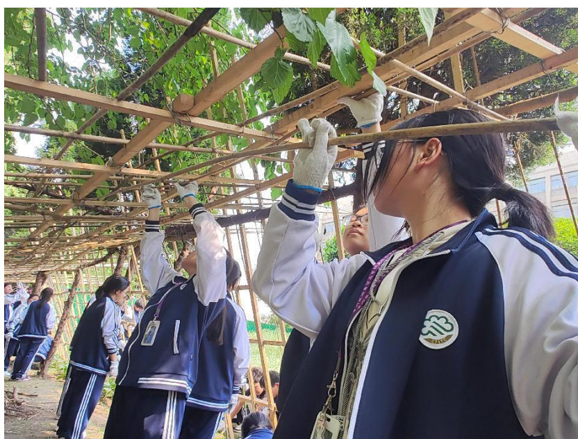
图 2 分院学生在“东坡农场”劳动实践