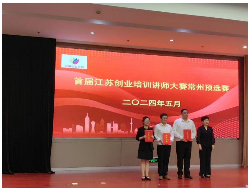
图 5 首届江苏创业培训讲师大赛颁奖