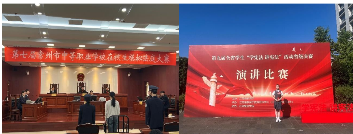
图 12 社团学生参加比赛