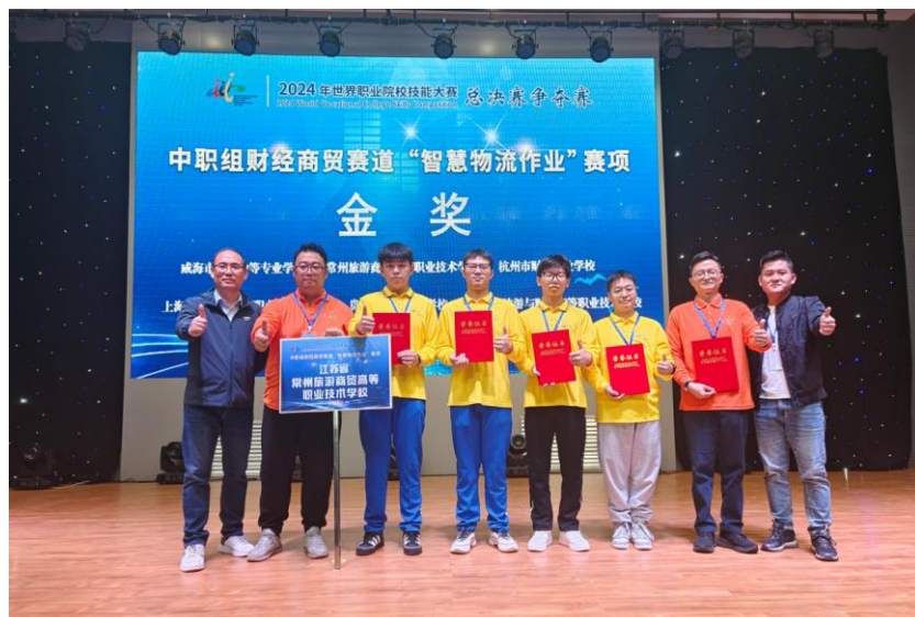
图 4 分院学生在 2024 年世界职业院校技能大赛总决赛荣获金牌

分院十分重视技能大赛工作，围绕各级各类比赛的具体情况，对集训工作提出了具体的要求，提出“市赛出线、省赛夺金、国赛冲金、争金夺银、完成指标”技能集训目标，将国赛设定为目标，通过技能比赛，真正实现“以赛促教、以赛促学”，促进师生专业快速发展。分院深入推进主教练责任制，强化系部直接管理、职能部门履行监管职责的管理体系，突出对集训工作细化过程考核，建立完善的巡查通报制度。2024 年，智慧物流作业赛项在 2024 年世界职业院校技能大赛总决赛争夺赛智慧物流作业赛项中荣获金牌，保持了国赛金牌五连冠，在 2023-2024 学年江苏省技能大赛中职赛项中分院共获得一等奖 5 个，二等奖 13 个，三等奖 13 个，高职赛项中分院共获得三等奖 3 个，分院也荣获 2024 年江苏省职业院校技能大赛团体优胜奖。