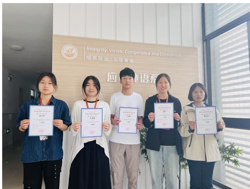
图 7 第四届全国数字贸易技能大赛获奖学生合影