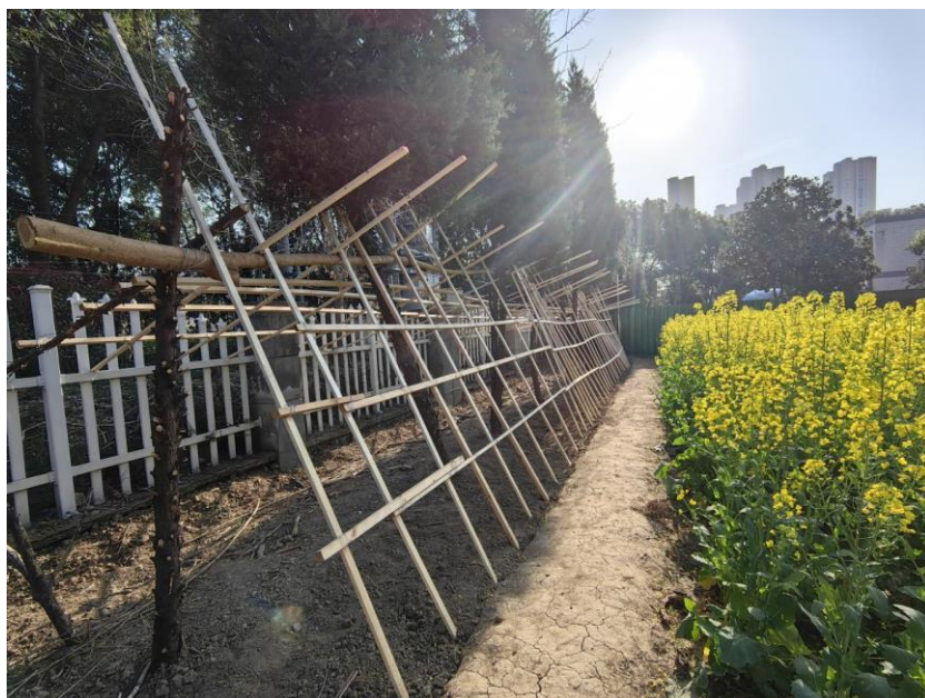
图 1 分院“东坡农场”一角