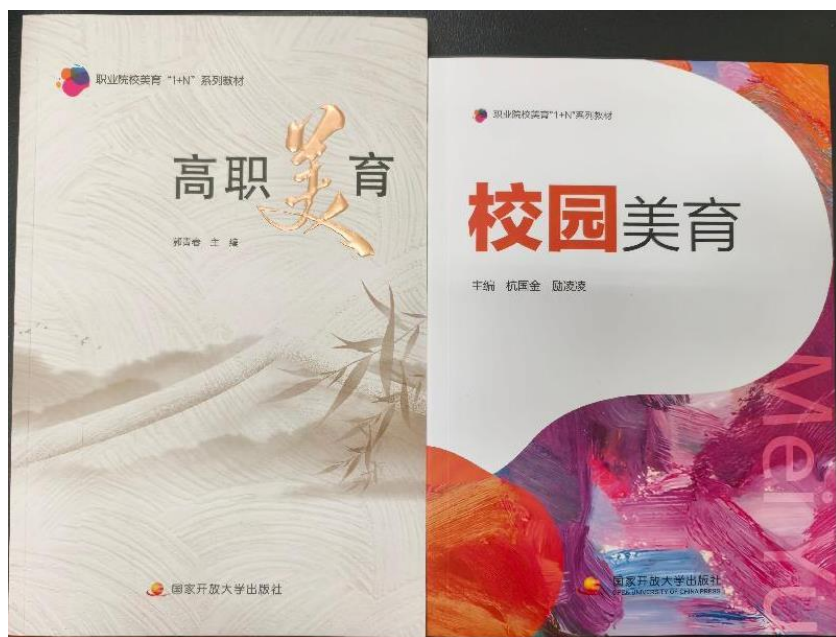
图 28 分院参编《高职美育》、主编《校园美育》教材出版