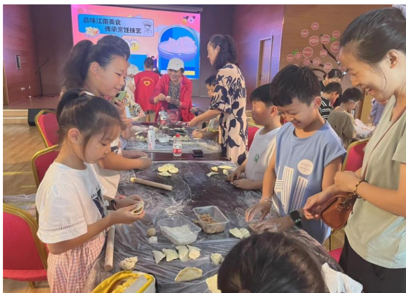
图 19 工作室开展“品味江南美食”活动

工作室积极整合社区内外的各类资源，与周边的菜市场、超市、食材供应商等建立了合作关系，为社区居民争取到一定的食材采购优惠政策，服务民生，降低了居民学习美食制作的成本。同时，还与当地的烹饪学校、美食协会等机构开展交流合作，邀请专业人士为学员举办专题讲座和技能培训，拓宽了社区居民的学习视野和知识面。