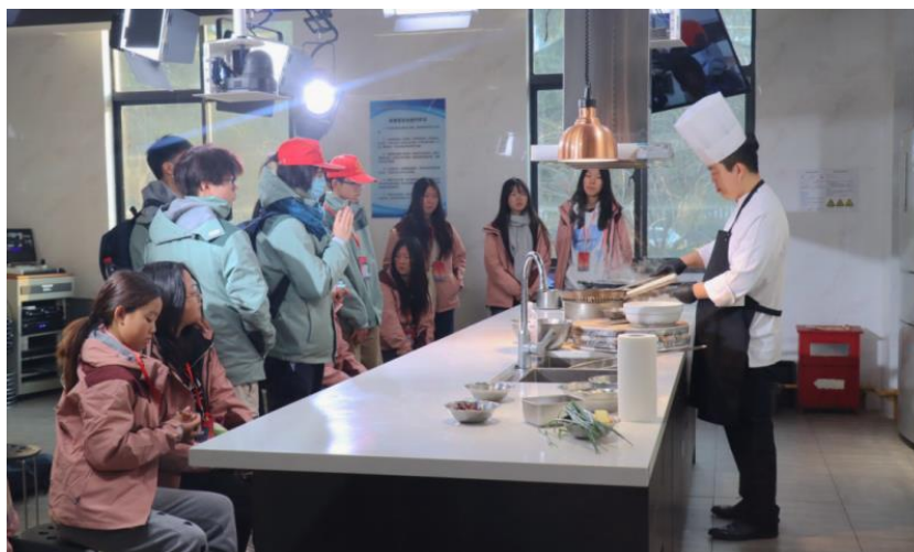
图 20 分院开设中国美食文化制作课程