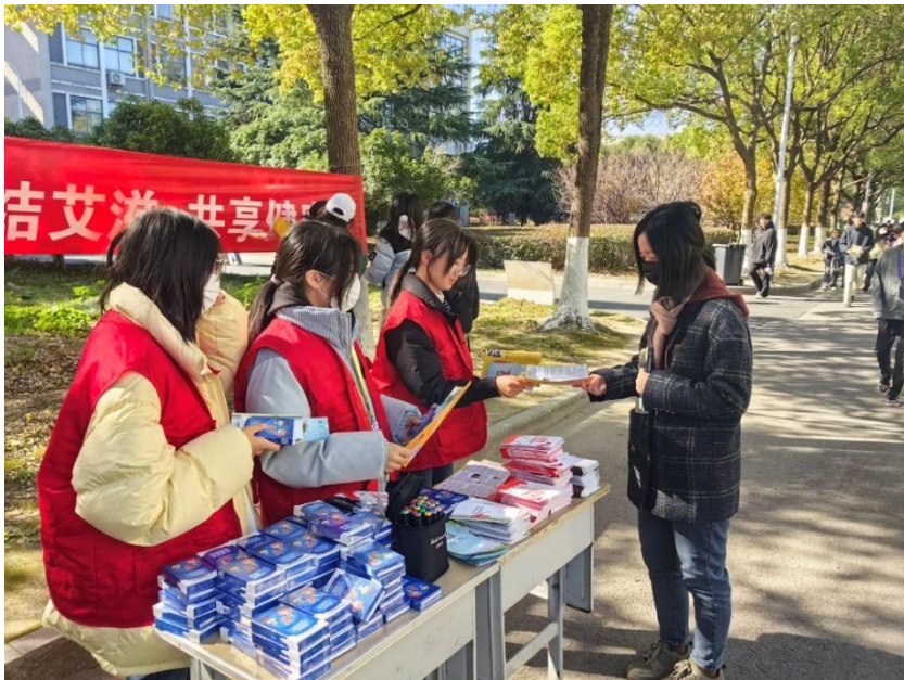
图 30 分院学生参与“预艾防艾”志愿服务活动