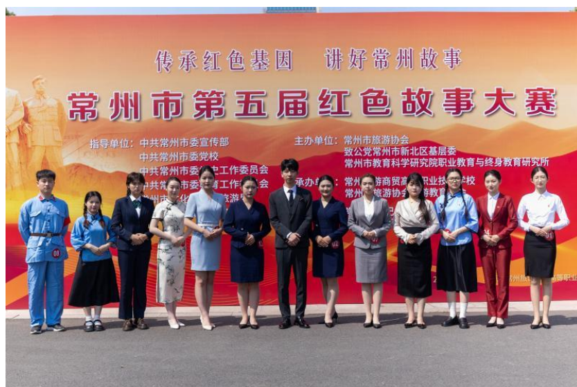
图 26 分院举办常州市第五届红色故事大赛

2024 年 5 月，分院成功举办常州市第五届红色故事宣讲大赛，来自江苏理工、常州工程、常州工业、常州纺织、常州旅商、常高职、溧阳中专、金坛中专等 8 所院校旅游专业学子齐聚旅商，讲述常州三杰、革命烈士、常州籍院士等人物的光辉事迹，坚定不移传承红色基因。宣讲大赛对旅游专业学子传播红色文化的实力进行了全方位、深层次的考量，大幅增进了参赛选手在创作、表述、传播等诸多方面的专业能力。以“小故事”传递“大情怀”，深度探寻红色资源背后所承载的人文价值和革命精神，激发了广大旅游类院校学生的社会责任感与历史使命感。连续五届红色故事宣讲大赛的举办，切实达成了“以赛强学”“以赛育人”“以赛促发展”的预期宗旨，为擦亮“三杰故里·红色名城”这一城市名片，强力助推文旅高质量发展注入了源源不断的新动能。