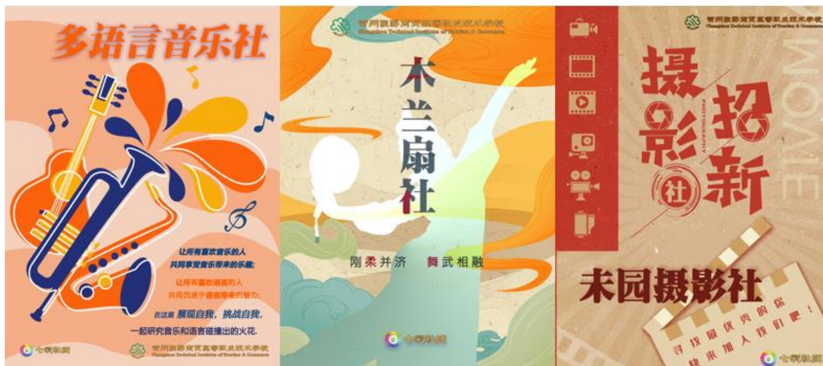
图 11 分院学生社团宣传海报

“五美”啦啦操社团在常州市中小学优秀学生社团认定活动中获评“十佳社团”。未来分院“七彩社团”将在思想引领和文化艺术方面继续精耕细作，争取联合德育教研室成立一批思政类社团，扩大思政课程影响力。借力东坡书画社、春秋民乐社、朗诵吟诵社以及即将上线的“如境”曲艺社，深挖中国传统文化元素，为助力打造“如境”校园文化氛围贡献力量。