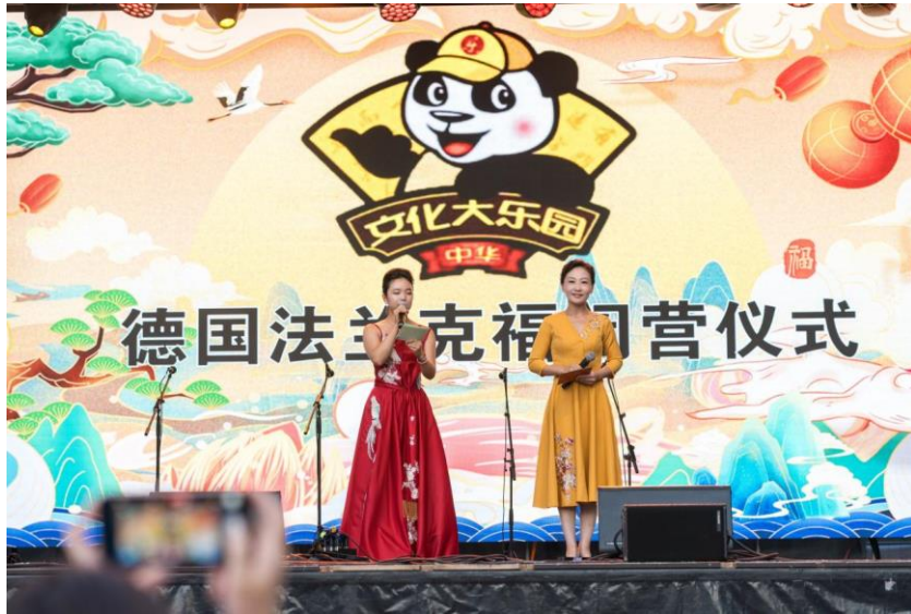
图 22 “2024 中华文化大乐园——德国法兰克福营”活动