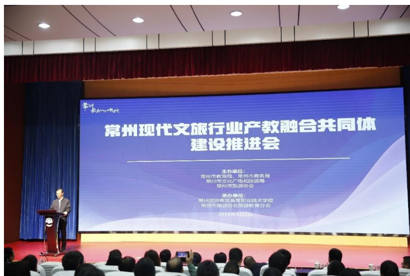
图 39 分院承办常州现代文旅行业产教融合共同体建设推进会