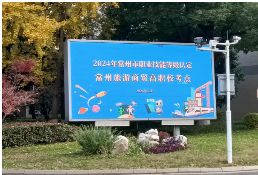
图 5 分院成为人社部门职业技能等级认定评价机构并开展技能等级认定工作

工作，在各系部的大力支持、以及产学合作处、教务处和继续教育部的协同工作下，通过广泛宣传动员、加强组织管理、挑选资深教师授课、强化教学管理，开展技能培训和职业技能等级认定工作。2024年分院成为人社部门职业技能等级认定评价机构，具备中西式烹调师、中西式面点师、前厅服务员、讲解员、电子商务师、广告设计师、营销员等27个职业（工种）职业技能等级认定评价资格，并于2024年12月开展了首批技能等级认定，共完成7个工种（中式烹调师，西式面点师、客房服务员、动画制作员、茶艺师、美容师、美发师）612人次的认定工作，其中高级工59人，中级工553人。分院在常州市职业技能鉴定中心指导下，稳步开展职业技能等级认定评价，切实履行各项工作职责，全力做好职业技能等级认定评价工作。