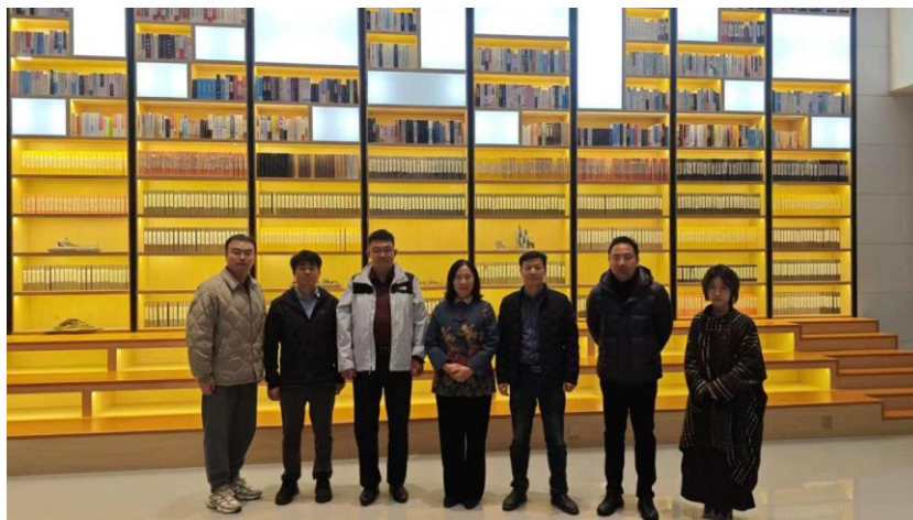
图 16 中成协领导来校调研美育工作