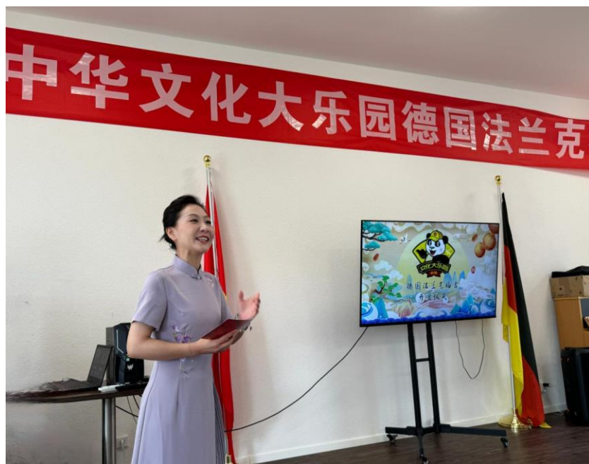
图 37 分院教师参与交流活动