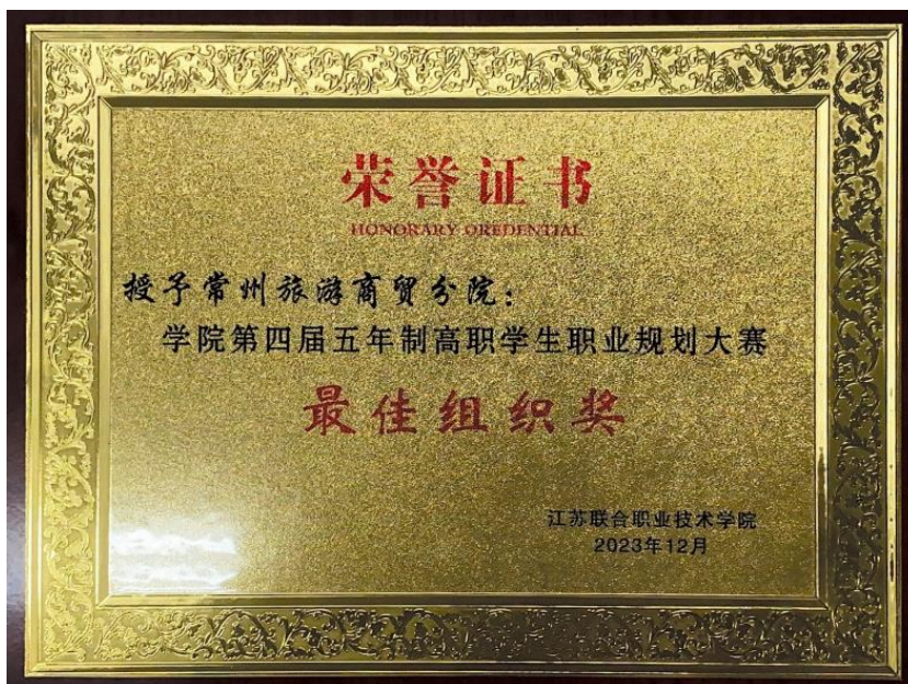
图 14 分院获得联院第四届五年制高职学生职业生涯规划大赛最佳组织奖

2024 届五年制高职毕业生 1145 人，涉及数字媒体技术、大数据与会计、市场营销、电子商务、现代物流管理、旅游管理、休闲服务与管理、烹饪工艺与营养、视觉传达设计、人物形象设计、商务英语、旅游英语、商务日语等 13 个专业。截止 2024 年 12 月 23 日，已有 1088 名学生通过就业平台审核，毕业生毕业去向落实率 95.02%，其中应征入伍 17 人，灵活就业 227 人，多数毕业生面向第三产业就业，专业对口率高，就业适配性好；应届毕业生满意度达 96.85%。