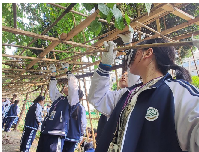
图 2 分院学生在“东坡农场”劳动实践