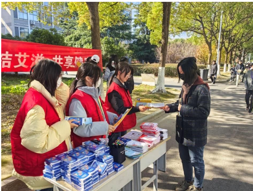
图 19 分院学生参与“预艾防艾”志愿服务活动