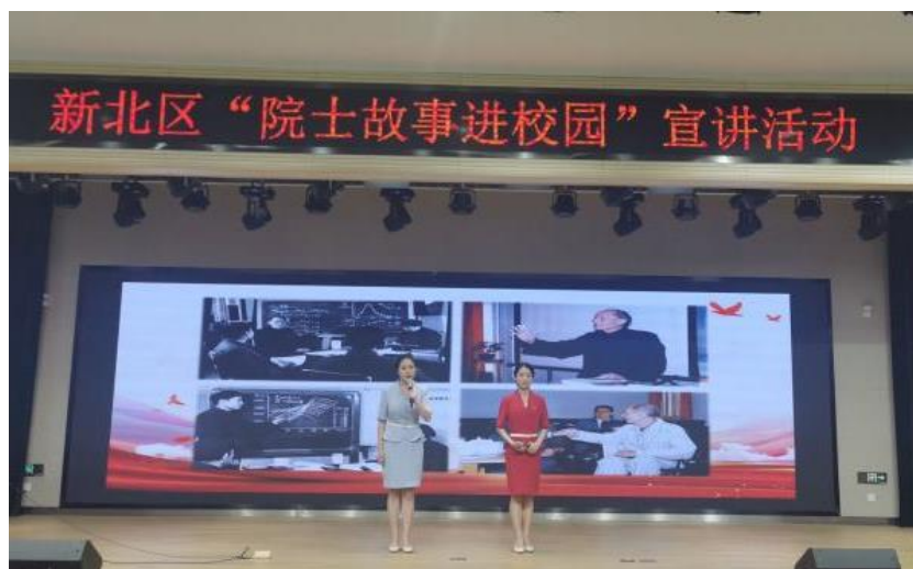
图 23 分院承办新北区“院士故事进校园”宣讲活动

程中，展现了旅商学子的风采魅力。未来，分院将持续发挥专业优势，为培养更多具有科学素养、创新精神和工匠精神的人才贡献力量。