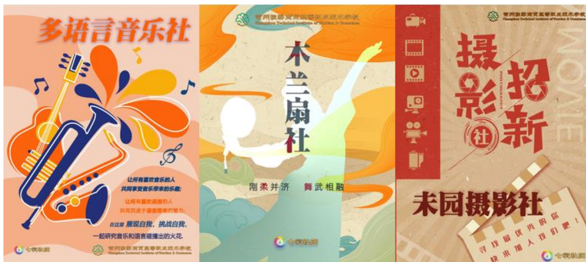
图 8 分院学生社团宣传海报

常州旅游商贸分院“七彩社团”秉承“内强素质、外树形象、展示自我、共同提高”的宗旨，分院现有社团 82 个，共分为 15 个大类，覆盖全校 75% 以上的学生，社团活动以周三下午第三节课为主，部分精品社团在指导老师带领下全面浸润于学校各项德育活动和竞赛中，助力学校发展与学生成长。分院“第舞元素”体育舞蹈社团在常州市中小学优秀学生社团认定活动中获评“精品社团”；“五美”啦啦操社团在常州市中小学优秀学生社团认定活动中获评“十佳社团”。未来分院“七彩社团”将在思想引领和文化艺术方面继续精耕细作，争取联合德育教研室成立一批思政类社团，扩大思政课程影响力。借力东坡书画社、春秋民乐社、朗诵吟诵社以及即将上线的“如境”曲艺社，深挖中国传统文化元素，为助力打造“如境”校园文化氛围贡献力量。