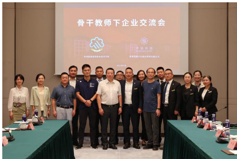
图 41 骨干教师下企业，产教融合育“双师”

为持续加强“双师型”教师队伍建设，提高教师专业技能和岗位实践能力，提升“双师”教育质量，2023-2024 学年，分院开展了骨干教师下企业实践质量提升行动，组织了一批骨干教师走进企业实践、挂职锻炼，为教师成长“赋能”，为分院发展“加油”，为企业腾飞“助力”。分院持续选派更多骨干教师走进企业和行业一线，了解企业对技术技能人才的需求标准，培养更多企业需要的人才，实现深度产教融合。