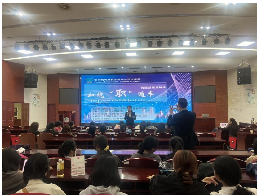
图 11 2024 届毕业生企业宣讲会