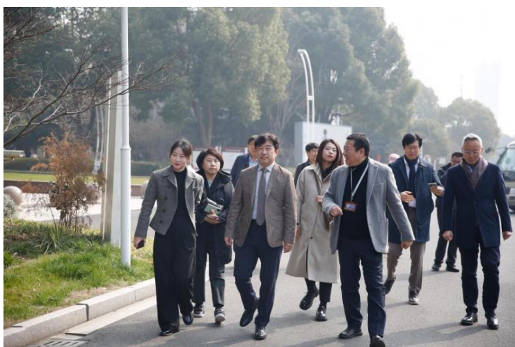
图 31 韩国春川市代表团一行来访

2024 年分院继续积极拓展对外交流合作新途径，3 月 8 日，韩国春川市代表团一行来访学校，实地参观了学生技能实训课堂，进一步拓宽了合作办学路径。