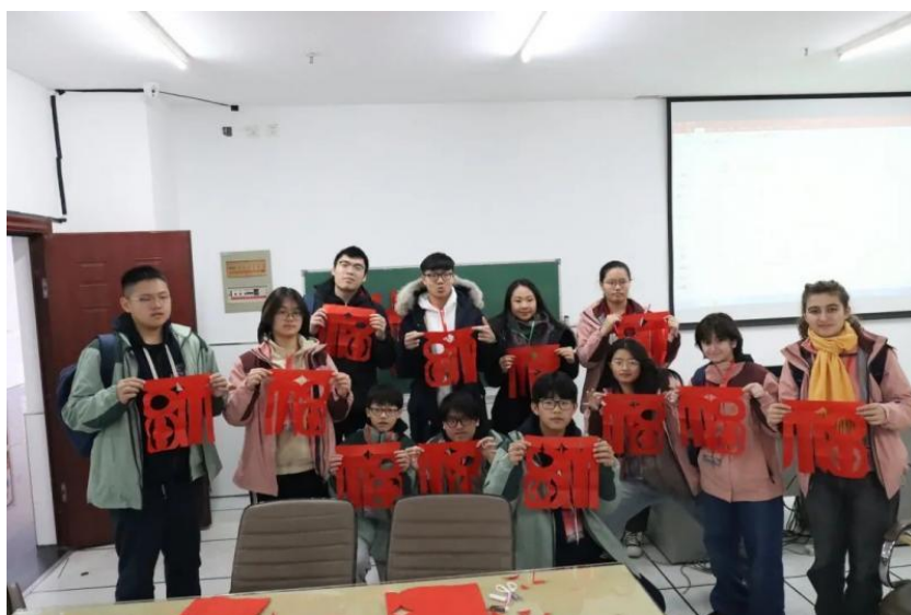
图 35 分院开设中华传统文化体验课程