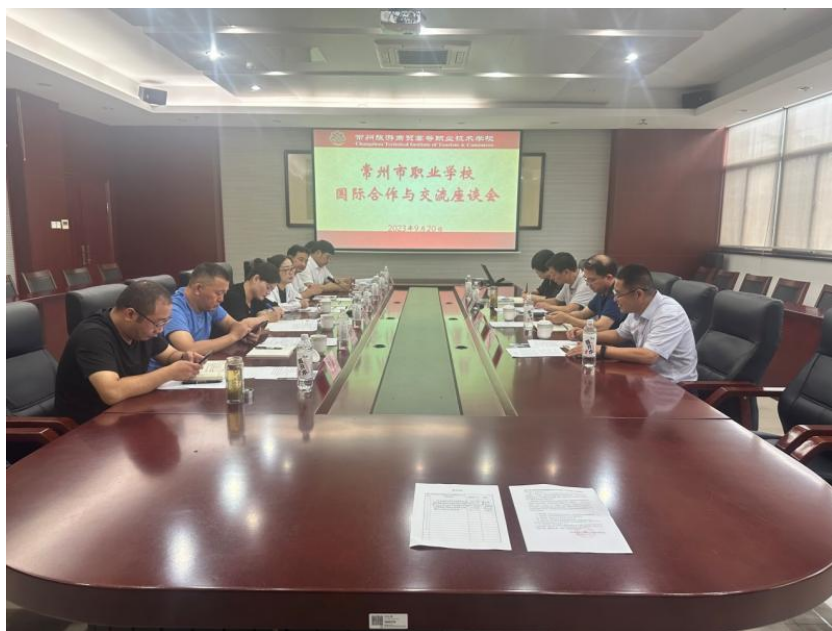
图 33 分院召开常州市职业学校对外国际合作与交流工作座谈会

2023年9月23日，由常州市教育国际交流协会、常州市职教学会主办的常州市职业学校对外国际合作与交流工作座谈会在分院召开。常州市9所职业学校的代表，分别介绍了各校在国际合作与交流工作中的经验做法、存在困惑、发展思考。在各校汇报的基础上，针对职业学校在国际合作与交流工作中教随产出、产教同行中的难点问题，国际化证书引进、国际化课程开设、对外证书培训、招收留学生等工作中的痛点问题进行研讨交流，探寻解决问题的思路 and 办法，达成了一定的共识。