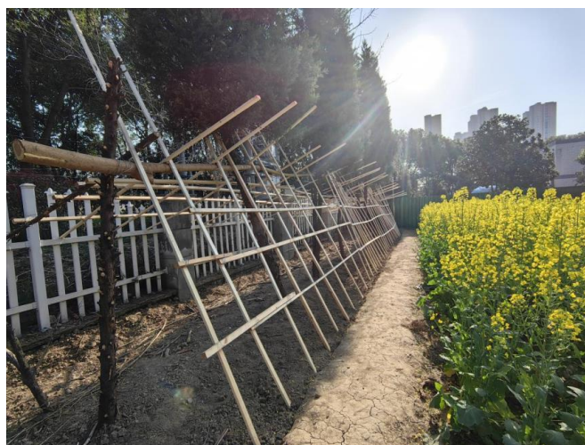
图 1 分院“东坡农场”一角

目前，分院通过综合实践劳动周、江苏省中小学生职业体验中心、常青藤实训超市、食育活动、家庭劳动、爱校劳动、劳模进校园等平台 and 途径不断促进学生动手能力的锻炼与提升、劳动意识与职业精神的塑造与升华。未来，分院将继续主动服务常州“532”发展战略，培养更多优秀的技术技能型劳动人才。