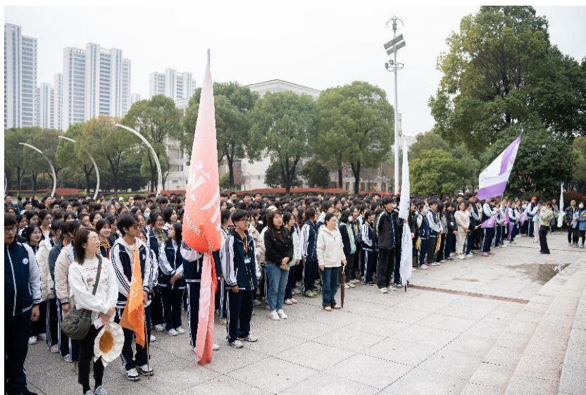
图 25 2024 年 18 岁成人礼暨毅行活动