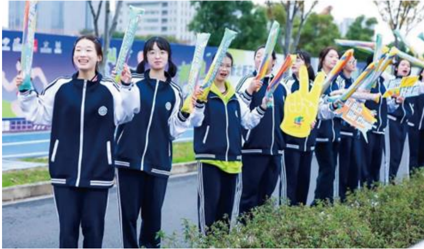
图 29 分院学生参与常州新北马拉松志愿服务活动