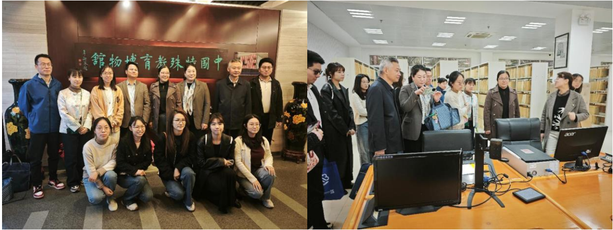
图 3 分院赴南京特殊教育学院学访