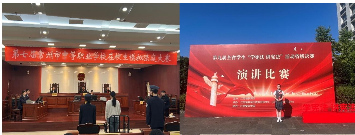
图 9 社团学生参加比赛