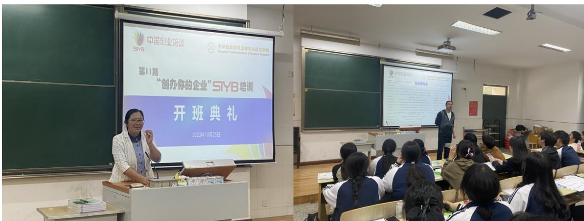
图 6 第十一期SYB创业能力培训班顺利开班

分院在关注学生技能成长的同时，也重视学生的创新创业教育，将双创教育贯穿于人才培养的全过程。2024年度，分院举行第十一期SYB创业能力培训班，60名学员顺利结业，通过率100%。近三年，毕业生创业人数逐年增加，2024届毕业生总数1145人，创业人数9人，创业率0.79%。