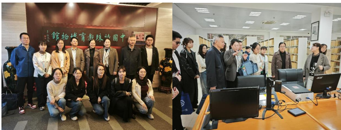
图 3 分院赴南京特殊教育学院学访

分院从2007年三校合并之初就接收第一批特需学生入学。2022年被评为常州市优质融合资源中心，2023年立项为江苏省融合教育示范校，认真落实特殊教育主体责任，积极探索职业教育与特需教育相融合的路径，助学生走自尊、自信、自立、自强的出彩人生之路。分院举全校之力建设的融合教育支持系统充分彰显了历史名校在推动新时代融合教育高质量发展中的使命担当。