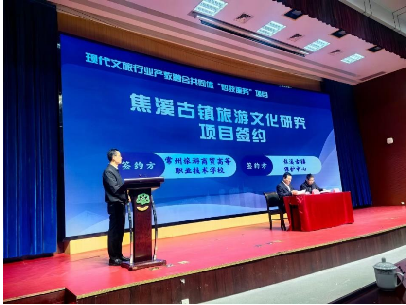
图 26 分院与企业签署合作协议