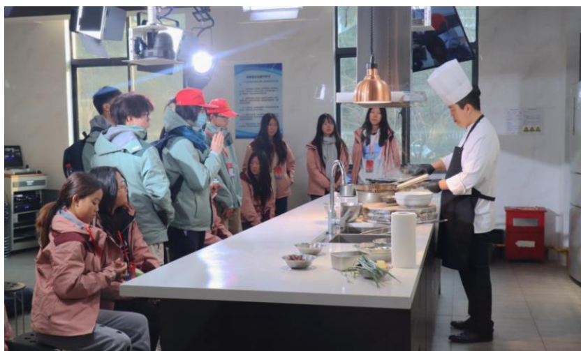
图 34 分院开设中国美食文化制作课程

近年来，分院多次协办“海外华裔菁英青少年大运河文化体验活动”，为中外文化交流贡献一份力量。同时，分院依托江苏省华文教育基地，发挥自身优势，积极举办各种中华文化交流活动，努力讲好中国文化故事，成为对外文化交流的一个窗口。