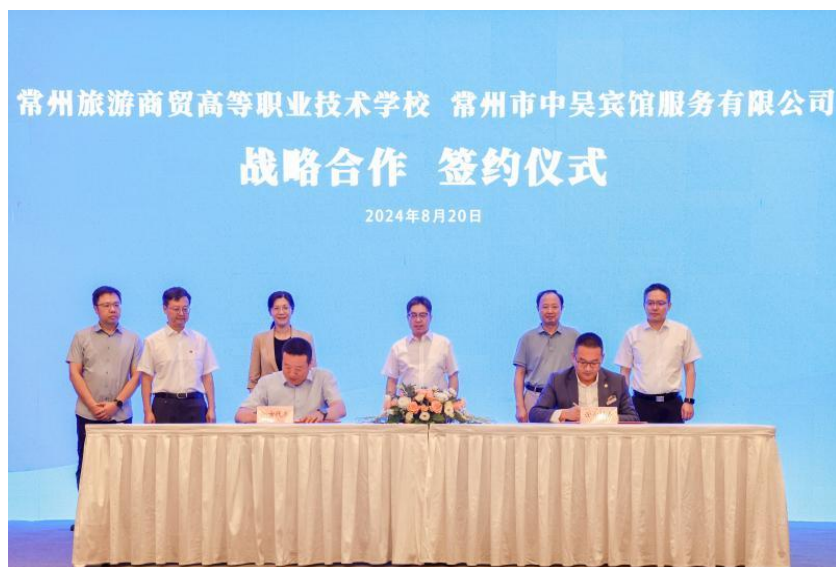
图 38 分院与常州中吴宾馆举行战略合作签约