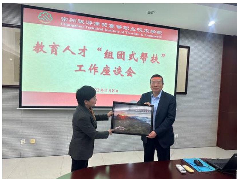
图 21 分院与岚皋县教育考察团进行结对帮扶融合发展签约