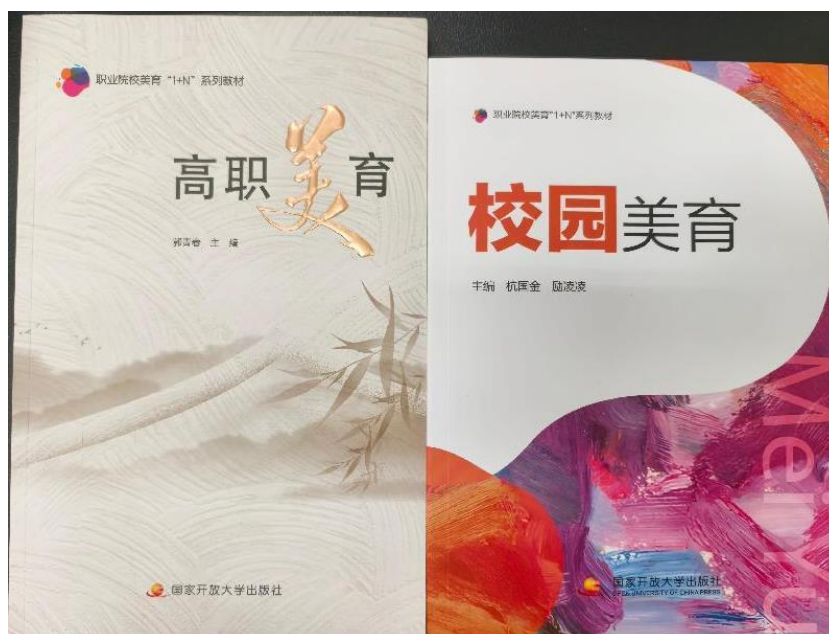
图 17 分院参编《高职美育》、主编《校园美育》教材出版