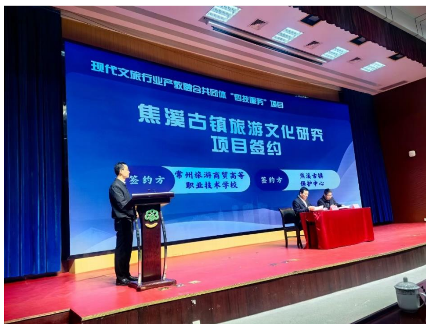
图 40 分院与企业签署合作协议