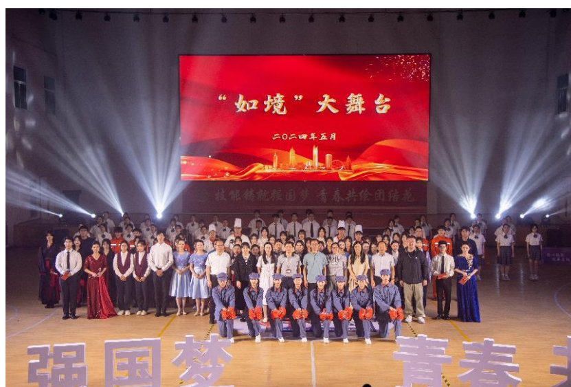
图 24 分院举行“如境”大舞台主题文艺演出

分院多次开展传承红色基因为主题的活动，以红色文化艺术教育为主要抓手，举行“技能铸就强国梦，青春共绘团结花”2024“如境”大舞台主题文艺演出，秉持“守正创新、出色出彩”的创作原则，结合今年职业教育活动周的主题——一技在手，一生无忧，展现分院新时代“五美”学子在新征程上各展其才、各尽其能的独特风采。组织2021级近千名学子开展了主题为“‘拥抱阳光，抗逆成长’——塑造‘五美’品格，争做时代新人”的18岁成人礼暨毅行活动，学生徒步约14公里，在老师、家长的陪伴鼓励下，正式跨过成人门，翻开了人生崭新的篇章，踏上人生新的征程。