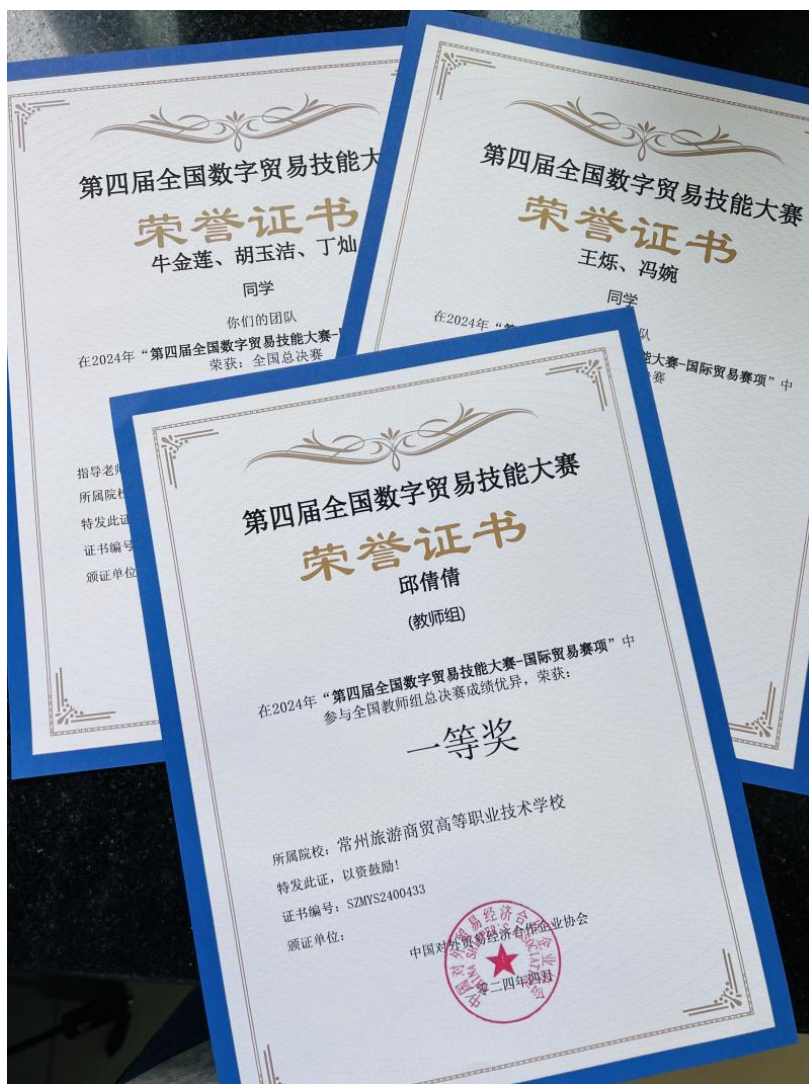
图 6 第四届全国数字贸易技能大赛师生获奖证书