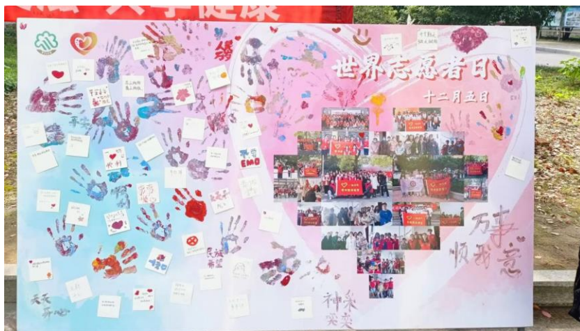
图 22 世界志愿者日宣传服务

分院紧紧围绕“专注现代服务业 培养国际化人才”的办学定位，全方位、立体式培养学生工匠精神，不断提升学生的职业素养，为学生踏上工作岗位打下坚实的技能与品质基础。围绕传承工匠精神，分院青年志愿者协会举办了各类活动，如3月8日国际妇女节的“内有半亩花田”造绿服务、4月22日世界地球日生态缸制作、端午节“艾意满满，粽享美好”传统文化服务、“以掌为媒”世界志愿者日活动等，用行动诠释奉献，用爱心传递力量。分院还组织红色宣讲队宣讲员走进常州市中小学，开展“院士故事进校园”宣讲活动，引导广大青少年以院士们为榜样，从小培养科学兴趣和创新意识，养成爱国精神、奋斗精神、奉献精神、创造精神、工匠精神。