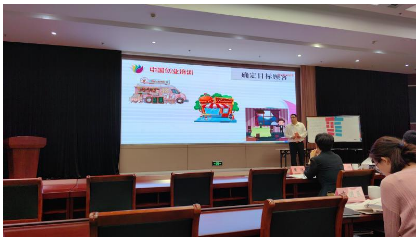
图 4 分院教师参加首届江苏创业培训讲师大赛