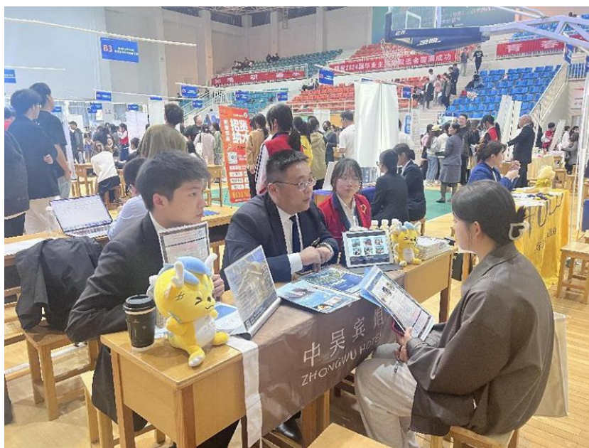
图 10 学生在 2024 届毕业生校园双选会上应聘

讲会于校云崧楼三杰厅隆重开启，此次宣讲会聚焦学生就业难题，为即将踏入双选会的毕业生点亮前路。常州瑞麟度假有限公司、中天西太湖有限公司、江苏九洲投资集团等五家优质企业依次登场，向学生展示了企业实力、项目蓝图、科技优势、职业规划、薪资待遇与发展机遇等方面的内容，为学生全方位的呈现多元就业前景，激发了学生兴趣，拓宽了毕业生的就业视野。企业宣讲会和校园双选会的举行，不仅实现了学校与企业、毕业生与用人单位的“双向奔赴”，更助力毕业生求职启航，也为学生逐梦未来全力护航。