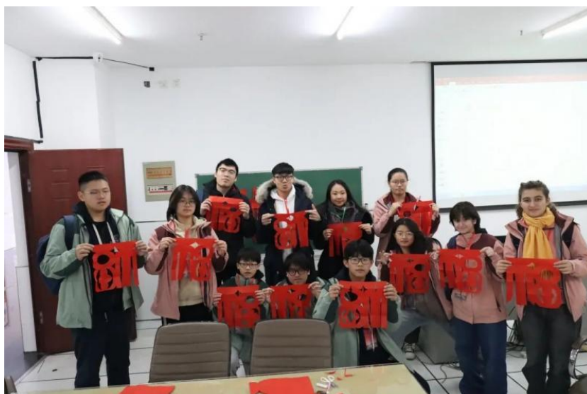
图 21 分院开设中华优秀传统文化体验课程